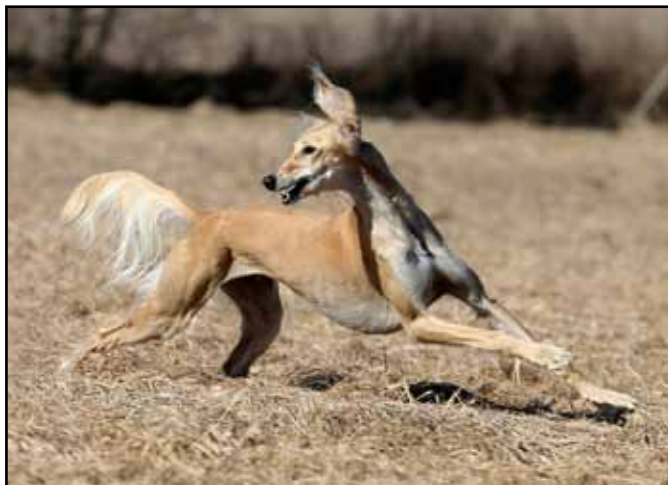
Qirmizi Magnolias största vinster 2015:

BIS i Norrköping, BIS på Tänga Hed, BIS i Borås, Euro Sighthound Winner i Danmark, BIS-2 i Askersund, BIR och Donaueschingen Winner 2015 på Europas störste vinthundsutställning i Donaueschingen.