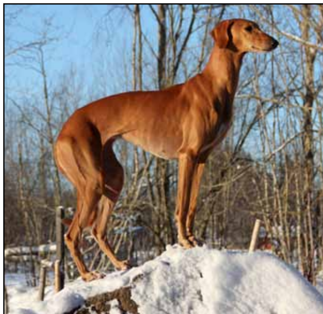
Lyra, superelegant släthår, här på sten i trädgården.