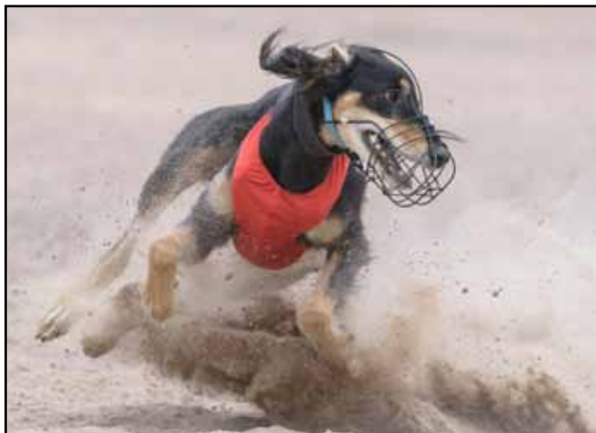
Olika konstruktioner ger olika fördelar på fältet. Mycket sitter i huvudet, mental styrka och jaktintresse är viktigt, liksom hundens kondition.