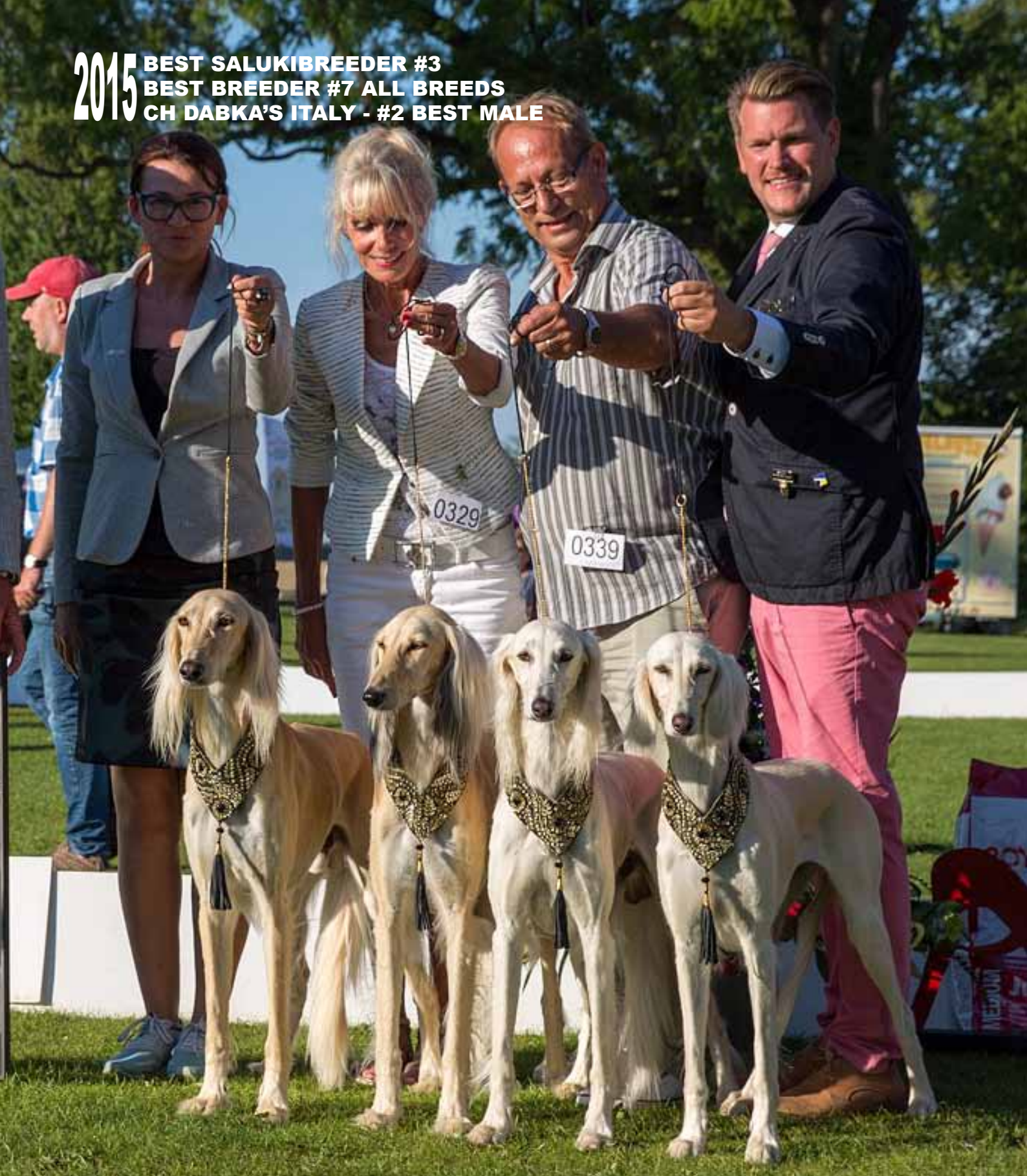
CH DABKA'S O'BOY THE SON OF IZZIE - CH DABKA'S MICHELLE - CH DABKA'S ITALY - CH DABKA'S NAOMI

2015 BEST SALUKI BREEDER #3 BEST BREEDER #7 ALL BREEDS CH DABKA'S ITALY - #2 BEST MALE