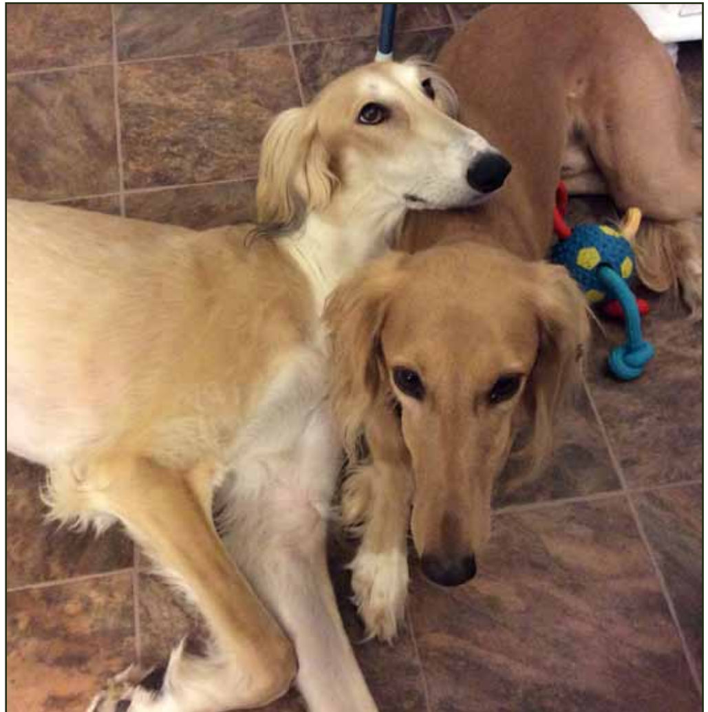
Keifer och Dahrius