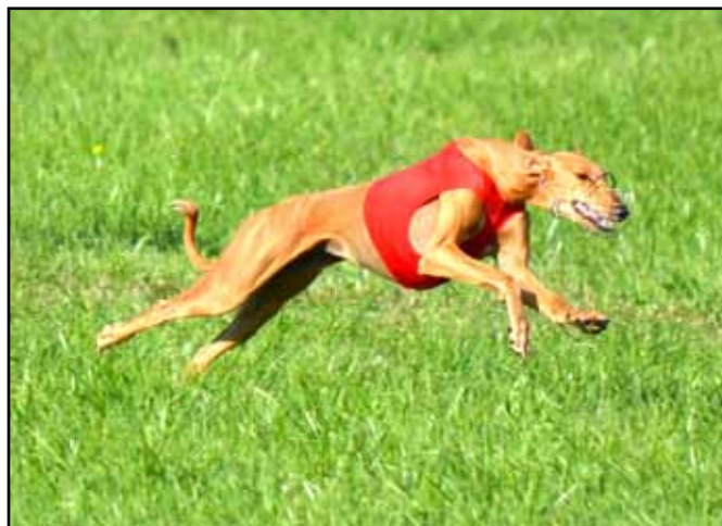
Årets Saluki kombinerat, Lyra, kan både springa och vara vacker.