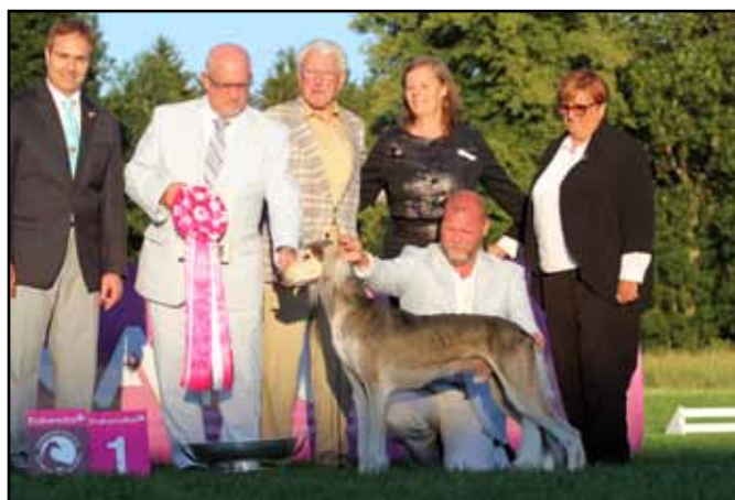
En av Qirmizi Ovations stora vinster, här BIS i Donaueschingen.

Vi strävar efter att föda upp rastypiska hundar av hög kvalitet och fokuserar inte stort på att de skall se helt lika ut i typ. Samtidigt vet jag inte om våra hundar ser ut som om de är uppfödda av någon annan även om man självklart ser vissa kvalitéer från andra kennlar, vilket förmodligen var syftet med