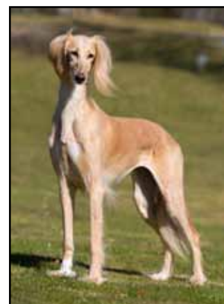
Årets avelstik 2015 CH Qirmizi Global Temptress