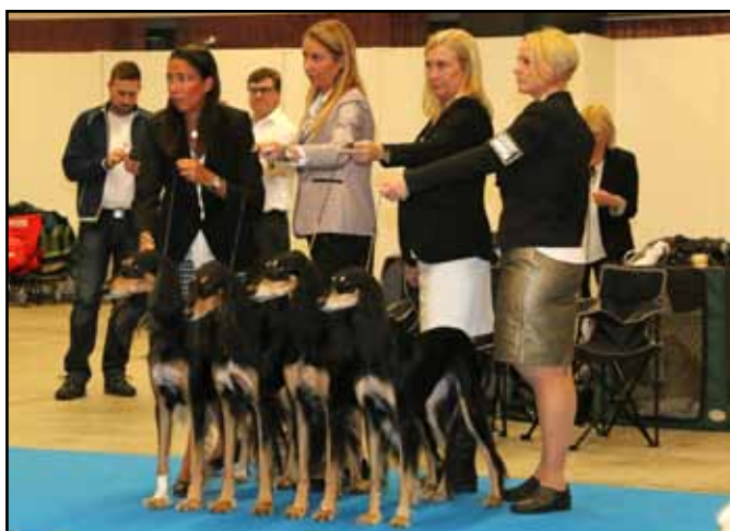
Året 2016 började bra för Kennel Badavie med BIS för uppfödargruppen. Andra hunden från vänster är Zack (Peaceful Mind) som också är med på bilden ovan.

Bilden togs i en stor inhägnad nära Arvåsen som har fantastiska ytor att springa på. Vi är så glada över alla vänner vi fått via hundarna.