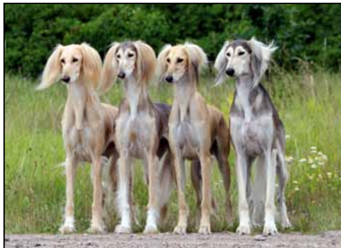
CH Qirmizi Global Temptress, CH Qirmizi Hermione, CH Qirmizi Magnolia & CH Qirmizi Ovation