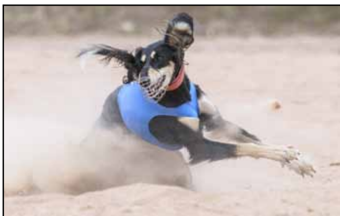
Hundar som gör en sväng, vänder först huvudet och därefter kommer kroppen. Kroppen kan dessutom vara vriden så framdelen är åt ett håll och bakkroppen åt nästa håll.