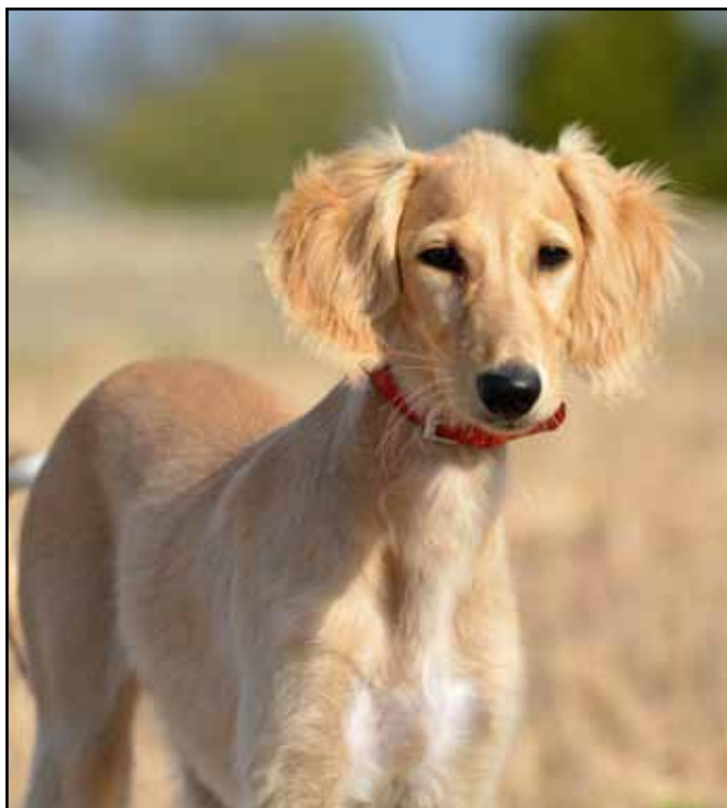
Barizha av Min Tera kallades Kruszkka och var söt som socker som valp.

Om man ser utifrån avelsperspektivet är det i alla fall enkelt att