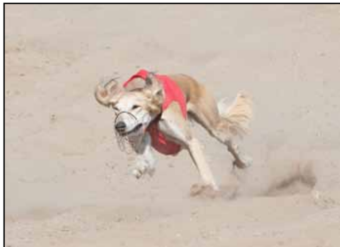
Salukin är en snabb sprinterhund i förhållande till storlek. Den ska ha kraft och förmåga att anpassa fart snabbt då det t ex uppkommer hinder och eller förändrad terräng.

Den ska vara en stark långdistansjägare. Men de ska också vara "sällskapshundar" och de ska kunna umgås med familjen. Allt i standarden har sin betydelse för syftet med rasen. Den kan trava på långa sträckor, men när den väl ser sitt byte galopperar den iväg under en lång sträcka. Salukins tassar är väldigt viktiga; starka och smidiga.