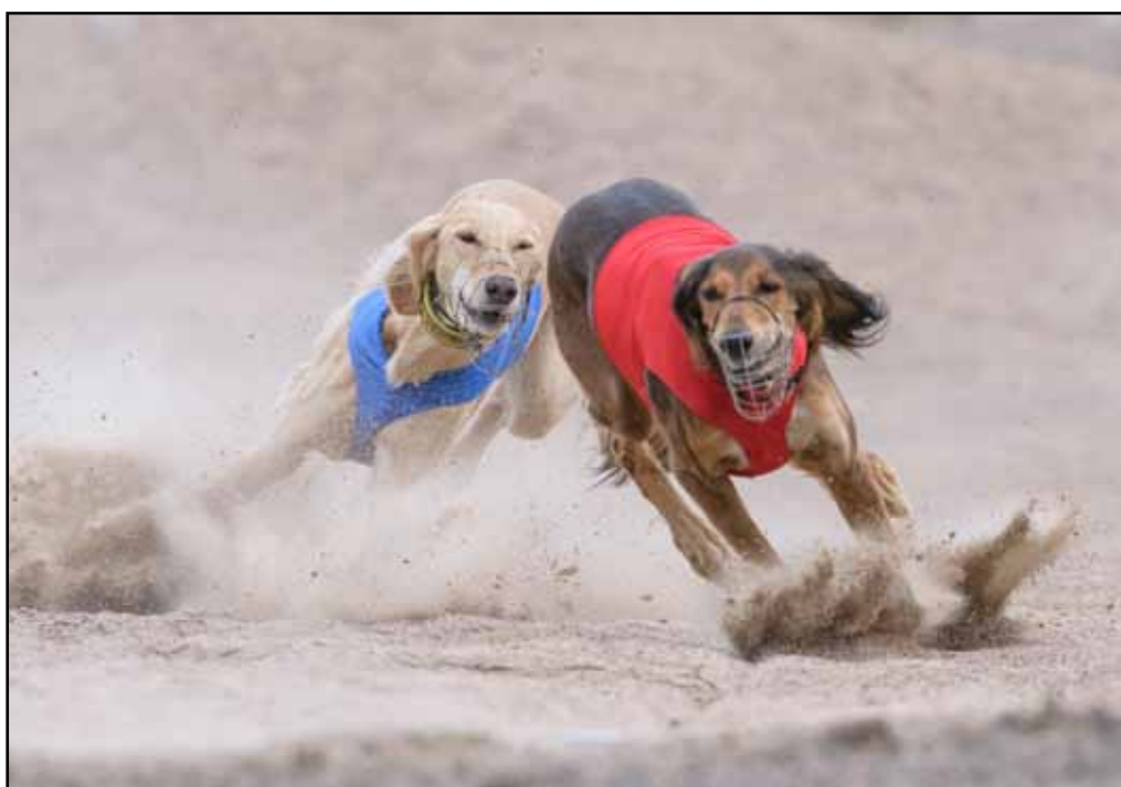
Det är viktigt med en muskulös nacke, en flexibel kropp och en korrekt svans för att kunna ligga lågt, ha fart, men också kunna göra tvära kast.

Länden ska vara lätt välvd, muskulös och måste vara flexibel för att kunna bli bollformad. Salukin i galopp är fullt utsträckt och i nästa stund fullt ihoprullad som en boll. Bröstkorgen måste kunna ha utrymme för inre organ, men får inte störa frambenen i rörelse. En tunnformad hund har inte flexibiliteten, den sparkar sig i sidorna. Underlinje ska vara väl uppdragen med "tuck up" och även detta är viktigt i flexibiliteten, i bollform. Flexibiliteten i kroppen är också mycket viktig i de tvära kast de ska kunna göra när de jagar. Vi kan se hundens bakdel och framdel åt olika håll för att snabbt vända efter haren. Hela kroppen är av betydelse.