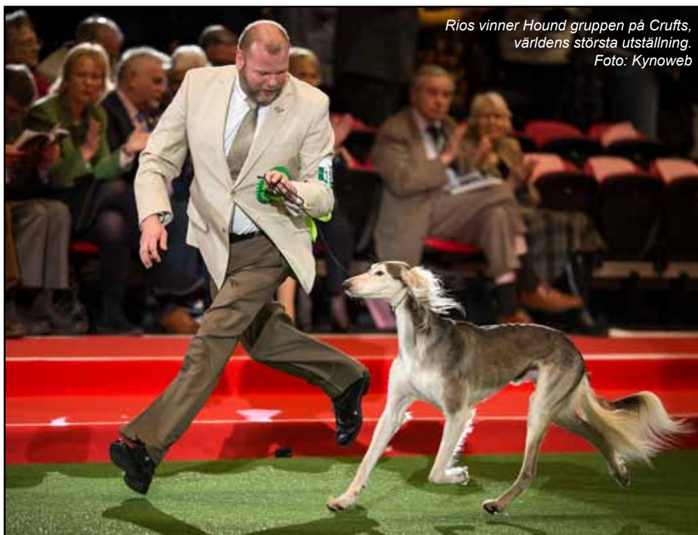
Rios vinner Hound gruppen på Crufts, världens största utställning.

Vår förhoppning är att para Katie under 2016 (påtänkt hane finns, men vi vill inte gå ut med det än) och då hoppas på att få behålla en tik efter henne som vi kan fortsätta med. Vår tiklinje finns ju bakom henne och förstas även efter Rios. Vi säkrar dessutom upp vår linje med att låna in en kullsystem, Chanel (Qirmizi Mirage).