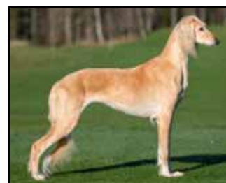
CH Qirmizi Global Temptress Gucci är 10,5 år på bilden.