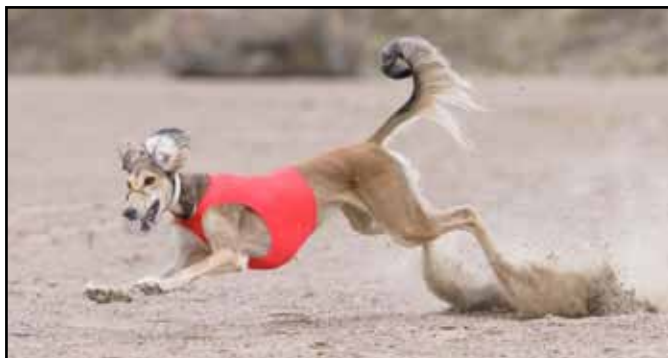
När den ska göra tvåra kast, vändningar, måste den bli mer upprätt och lyfter sig nästan i kurvorna. I snabba svängningar ska de använda sin svans för balans.