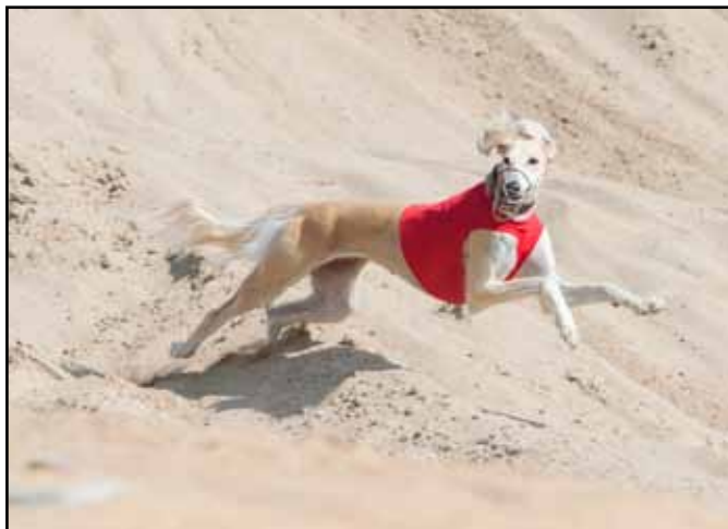
En hund som springer upprätt, utan fart, har oftast gett upp. Men det kan även vara t ex en ung hund eller att den söker, för att den har tappat luren.