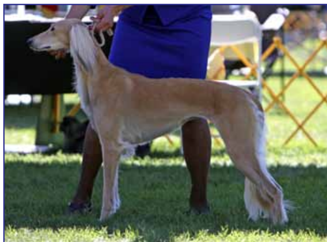
Bred By bitch (senare reserve WB): Mazada Mata Shiraz Life is a Song Worth Living (Z'bee's The Time Of Your Life At Mazada x Shiraz Khan D'Lyla)