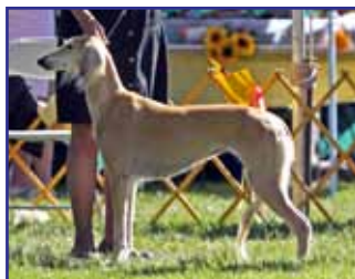
Award of Merit: Jamora Pink Sapphire (Shiraz Global Storm x Jamora Angel Face)