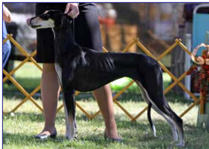
Open Bitches (blev senare WB): 7Seas Parfait Miss Behavin' Al Sayad (Ladyhawk Blackgold Of Britestar x 7Seas Int'l Safar Al Sayad)