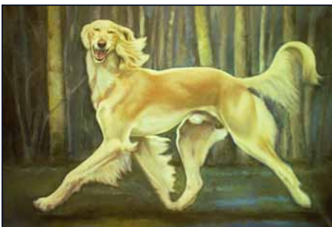
Saluki i olja på canvas