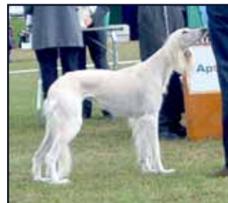
FI CH Kuriirin Casablanca

FI CH Casablanca Chabek Chardonnay Chopin