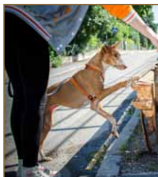
Att sätta tassarna på det smala staketet är inte lätt.