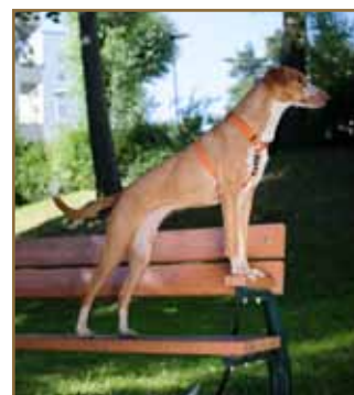
Tassarna på bänkarmstödet.