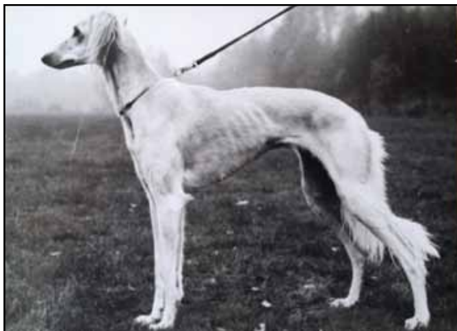
INT & NORD CH Ibinores Ryhl Ismene.