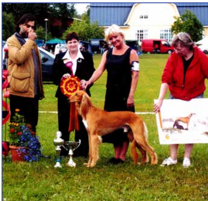
Ch Kirman Vasuman

Asarafi fortsätter -90 med sin C-kull (Oazis Al-Sharq Amir/Ibinores Zarifa) och -91 med Don-kullen (två hanar) e. Ch Sahrai Kookab-