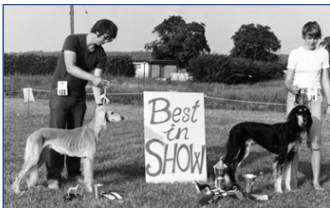
Int Ch V-73,-76 Kirman Rumba BIM med sonen Int Ch Sfinksin Jungmanni BIR, Skokloster SVSR 1978