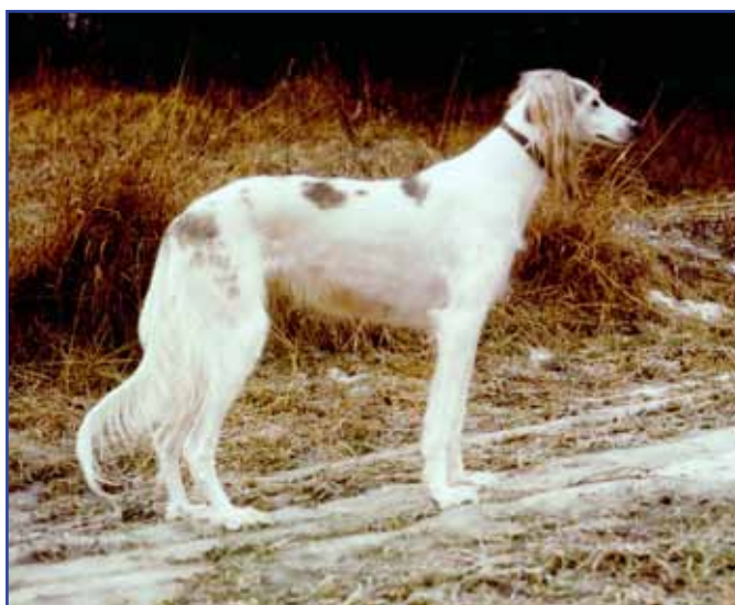
Ch Northsea of Daxlore