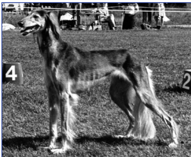
Int Ch Kirman Asmayana BIS Skokloster SvVK 1977