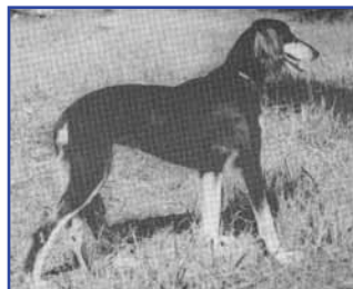
Ch Mazuri Zahilat