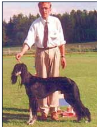
FI CH Kuriirin Armani