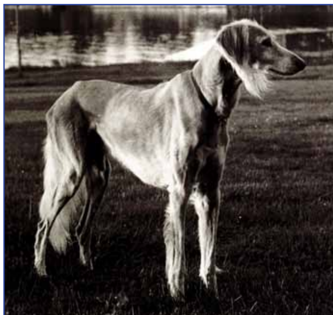
Int Ch V-67,-70 Sadruk del Flamante