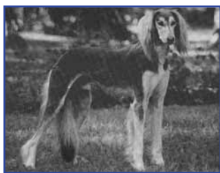
INT NORD CH Wallaby's El Shaah, född 1987 (Nord Ch Omani Mokka - Wallaby's Bahr El-Ghazal)