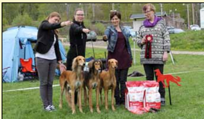
BIS UPPFÖDARGRUPP Kennel Dhawati