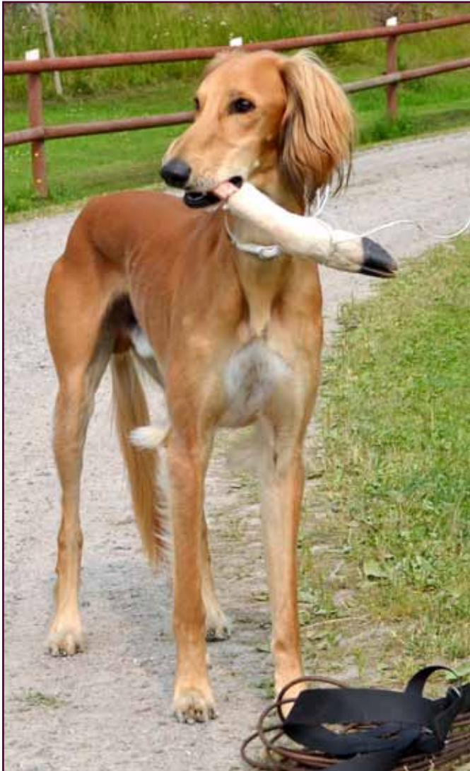
lorek bär stolt belöningen efter ett viltspår - hjortklöv.

Intervju Marie Palmqvist