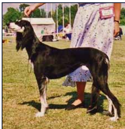
CH Shebnaz Saga, Hannus första saluki och stamtik på kennel Kuriirin.