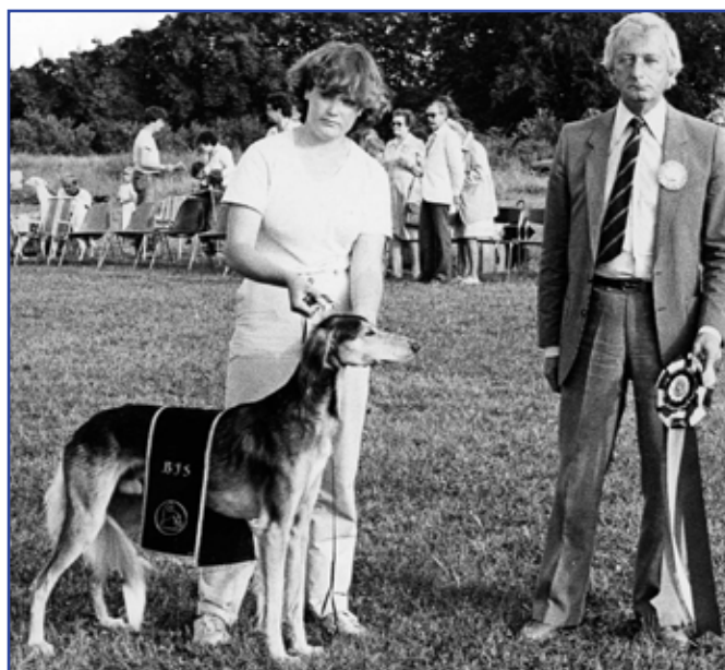
Int Ch Kirman Feriyat BIS Skokloster SvVK 1981