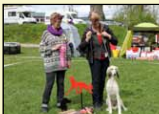
BÄSTA HUVUD & UTTRYCK Galerita's Pilosella