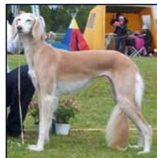
CH Shafaq Jihna Ez Jingles, mor till D- och E-kullarna.