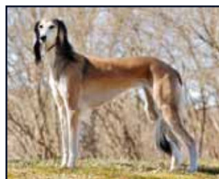
Kuriirin Giada Gio