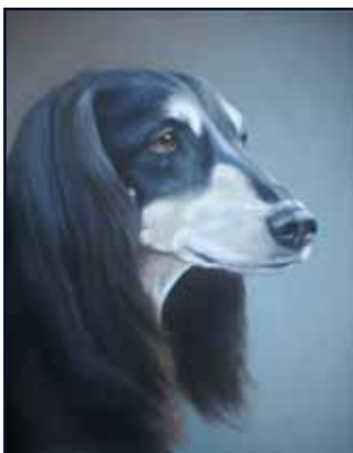
Saluki i olja