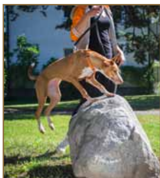
... och ner.