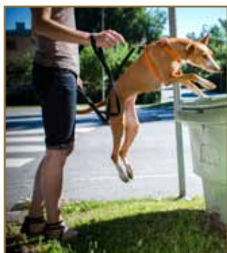
Upp på sandningslådan.