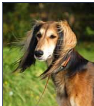
Kuriirin Huron Navajo

Hoopa Navajo Hualapai Navajo Huelel Navajo Huichol Navajo Huron Navajo Huichun Navajo