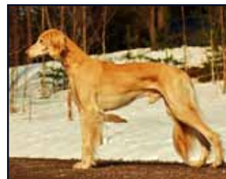
FI CH FI JV-02 Kuriirin Dolezal Deverre