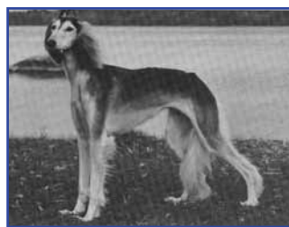
FI CH Wallaby's Gamiya-al-Gitan, född 1988 (Int & Nord Ch Aramika's Azimut - Nord Ch El Hamrah Kajanda)