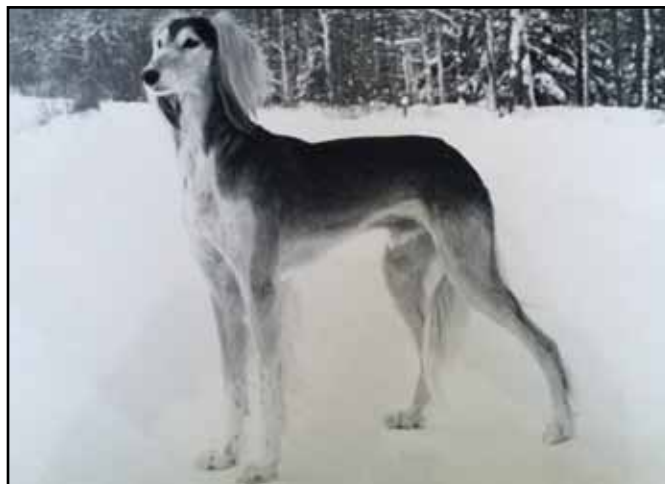
INT & NORD CH NORDV-78,-80 Schiram Schiramibicus