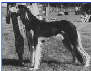
INT NORD CH Aramika's Azimut, född 1982 (Int Ch Kirman Khayal - Int Ch Kirman Aramika)