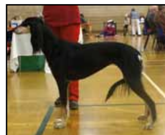
Reserve Best Bitch, Reserve Challenge CC CH Glenoak Kamala JW