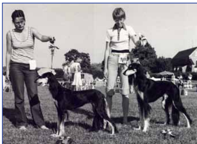
Ch Srinagar Tanyatu of Kirman BIR & Ch Sfinksin Jungmanni BIM, Skokloster SvSR 1983