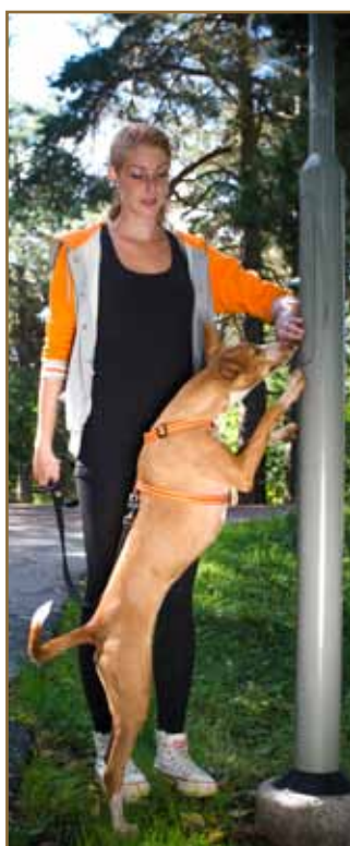
Lyktstolpar kan vara en utmaning då de är hala.

Gå in på vår hemsida www.dogparkour.se för att låra dig mer om dogparkour och bli medlem i vår Facebook-grupp, Dogparkour Sweden, för att inspirera och inspireras av andra hundägare.