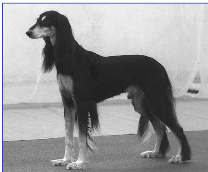
Int ch El Hamrah Farraar, mångfaldig BIS-vinnare