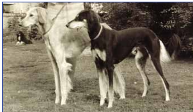
13 månader gammal Sadruk del Flamante med sin mor Ch Firousi del Flamante