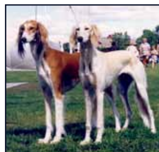
FI CH Shebnaz Sabaka & FI CH Kuriirin Bianca Bey