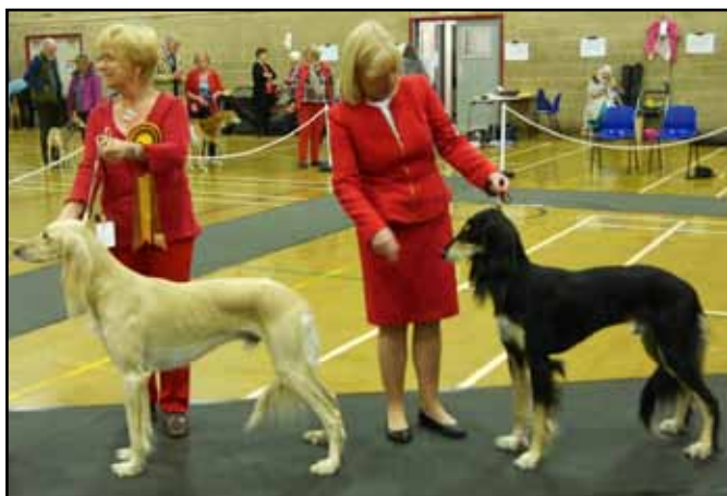
Best Dog, Dog Challenge CC, BOB/BIS Ch Glenoak Kiyan JW & Reserve Best Dog, Reserve Challenge CC, Ch Classicus Cassander