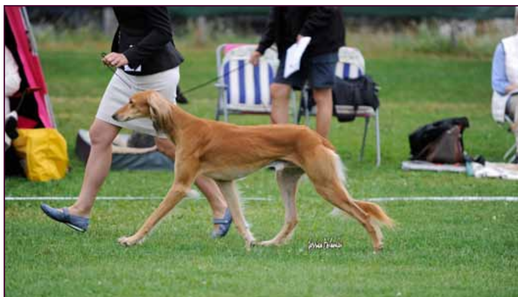
Dhawati Uday Karam - inte bara funktionell utan vacker också. Här springandes i utställningsringen.

Lycka till och ge inte upp, det tar tid att få en bra spårhund!