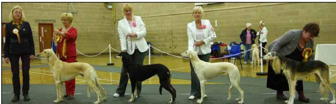
Glenoak Kiyan BIR/BIS Bästa hane, Caryna Meilichia Reserv BIS, Bästa tik, BIM, Caryna Neferti BIS Puppy & Chisobee Serenarian BIS Veteran.

Salukibladet har bett mig skriva lite om mina intryck från utställningen och om min bedömning av de 96 salukis som var anmälda, med 123 starter i 28 klasser vid denna utställning.