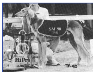
FI RCH DV-90, FM-90,-91 Nordwart Midas, född 1988 (FI & SE Ch Jailendahl's Fabian - Mase)