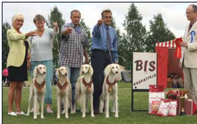
Kennel Kuriirin med BIS-vinnande uppfödargrupp.