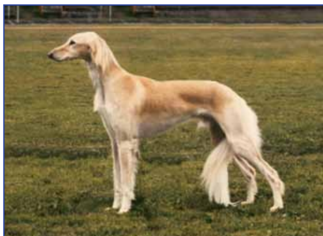
Int Ch El Hamrah Bazman