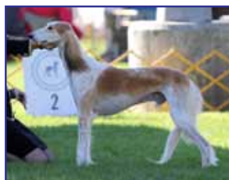
CH Jamora Bahja Shiraz Tuscan Mosaic (Jamora Bahja Tuscany x Shiraz Khassandra)