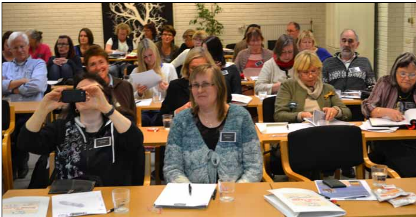
Enighet vid Raskonferensen i Ramnäs 2012 - bevara vår urgamla ras! I oktober får vi se hur vi levt upp till detta.

Alla salukivänner - kom till Raskonferensen i Ramnäs den 24-25 oktober och diskutera detta med varandra och med våra experter.