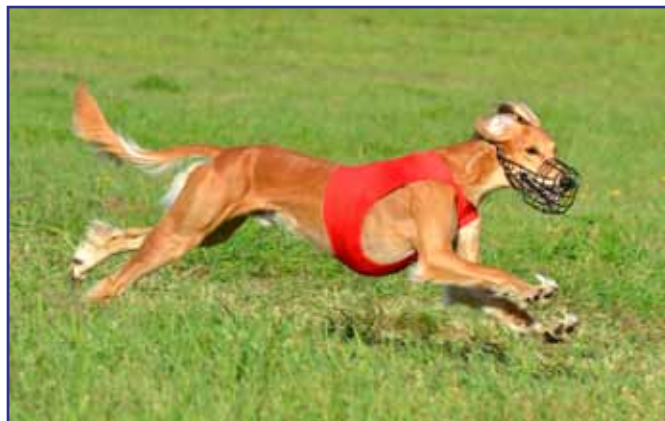
Dhawati Uday Karam, lorek - välbalanserad med långa, marktäckande och energibesparande steg.