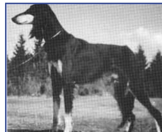
Ch V-57,-58 Farao of Kaukajärvi