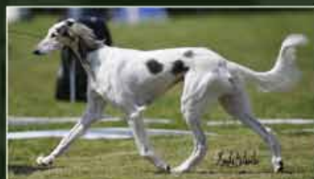
Deanna become DE CH & DK CH with BOB and also proud mother of our D-litter

Ashantii won several BOB-Veteran at SKK with BIS placements and also BOB and group 3. She was best bitch 10 on the salukilist.