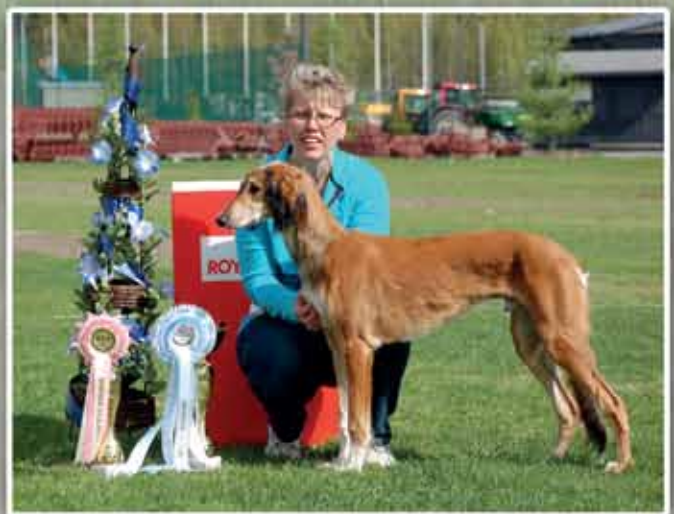
All breed puppy show 14.5.2015 BIS-2 El Hamrah Maher