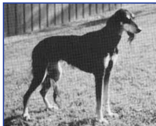
Ch V-62 Ashfar Sheeba