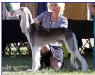
CH Ladyhawk Guinness The Menace of Tazi (Srinagar Glory Halelujah Of Ladyhawk x Ch Srinagar Priska)