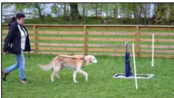
Mamma Garwen - lugn och trygg genom hela banan.