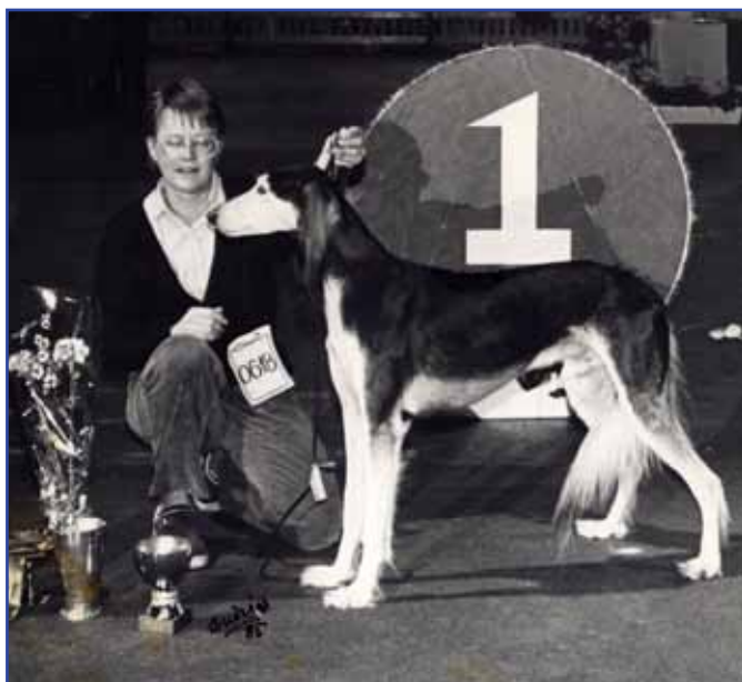
Int Ch V-83,-85 NV-83,-85 FinB Ch DV-82 Kirman Khayal här som gruppvinnare i Stockholm på NordV-83