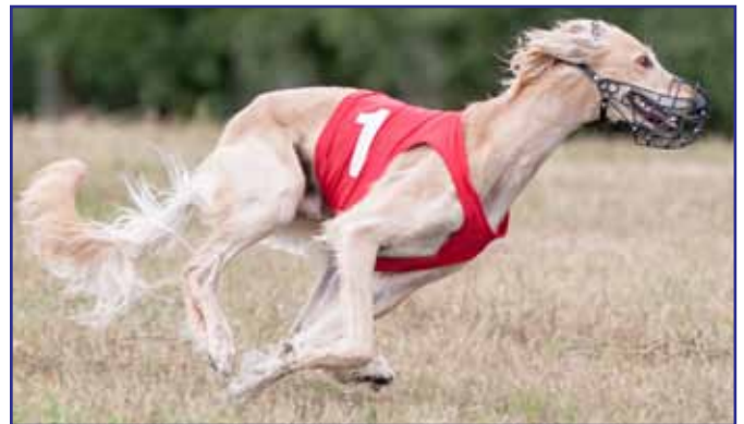
Sharwassim Ajib ibn Shaitaan, Jibbe - erfaren och läser banan snabbt.