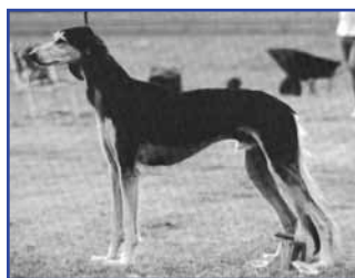
INT NORD CH V-83,-85 NV-85,-86 Fi RCh DV-82 Kirman Khayal, född 1980 (Ch Kirman Esfahan - Int Ch Kirman Daraya)