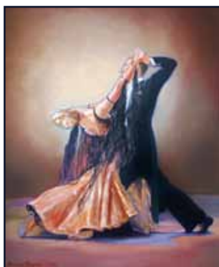
Dansare i olja på canvas