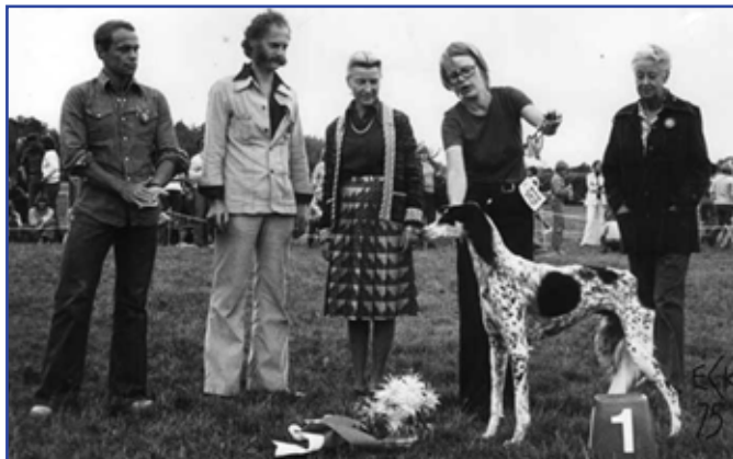
Int Ch V-77 Kirman Viikari BIS Skokloster SvVK 1975