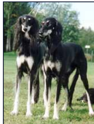
FI CH, PMV-97 Kuriirin Arabella och Kuriirin Arabanda