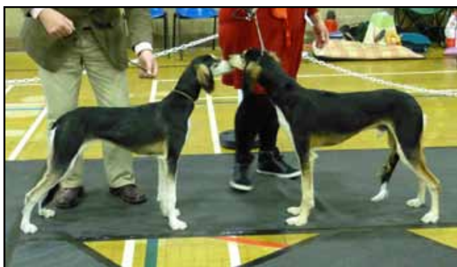
Minor Puppy Bitch och Minor Puppy Dog Kasaque Salaama & Kasaque Shabaz Nefisa

Jag har dömt salukis i Storbritannien två gånger tidigare: dels på Thame Agricultural Open Show 2000, och dels på Richmond Championship Show 2009.