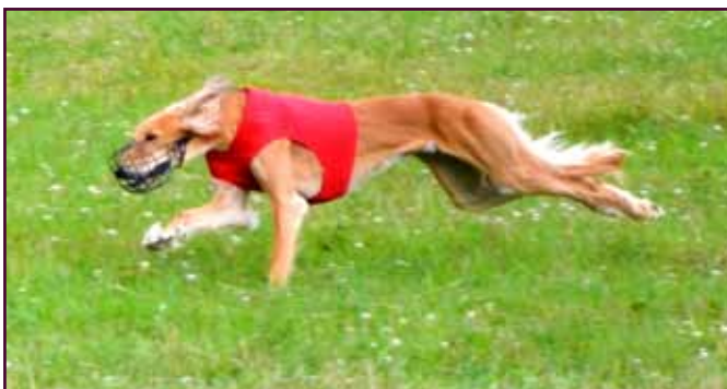
lorek sträcker ut på lure coursingbanan, en aktivitet som både hund och ägare tycker om.

Dhawati Uday Karam, kallad lorek till vardags, är den första salukin i Sverige att erövra titlar i viltspår, utställning och lure coursing. Han fyller 3 år i juni och är redan Svensk Viltspår Champion, Svensk & Dansk utställnings champion och Svensk Lure Coursing Champion.