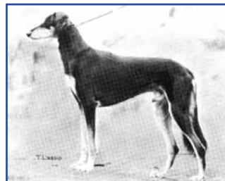
Ch V-66 DV-65 FM-64,-65,-66,-67 Faraji del Flamante