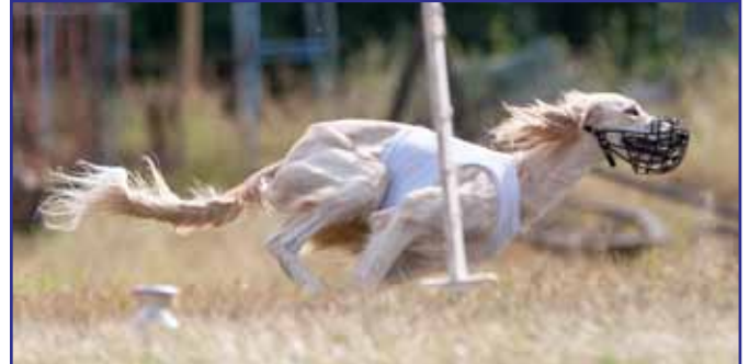
Haefen Galaxie för Sharwassim, Galaxie - snabb och stark.