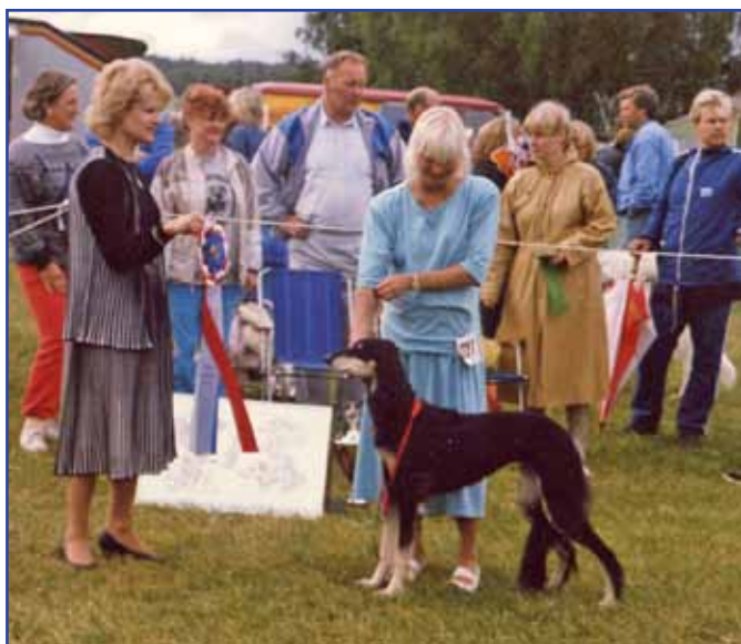
Int Ch Kirman Kahraba BIS Skokloster SvVK & SvSR 1987

exporteras till Norge och får båda en valpkull där, syster Ch Jivatha i Finland. Al-Faraz har sin andra salukikull med bokstaven G, (Beduin/Sahrai Faruna), tiken Gala-Maya går till Sverige och blir använd i avel där, syskonen Ch Ghalif och Ch Gazella här. Sfinksin har sin M-kull e. Kirman Effendi u. Sfinksin Kaarna och Al-Yaman har sin andra och sista kull e. Sahrai Carthus u. Metsänreunan Hyrrä, J-kullen.