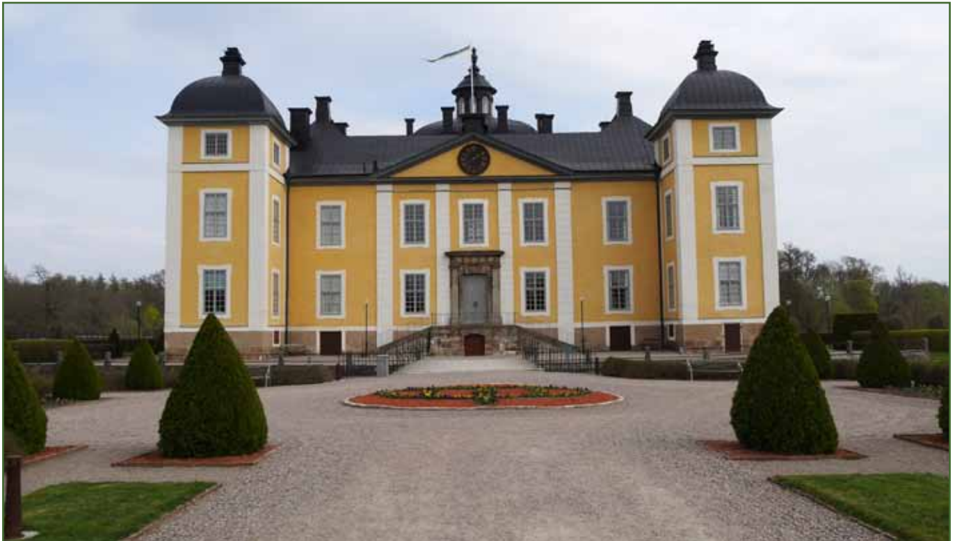
Strömsholms slott, idag museum för svensk 1800-talskonst, byggt 1681 och tillhör idag svenska staten. Till höger före slottsträdgården ligger Stenköket, mat och café.