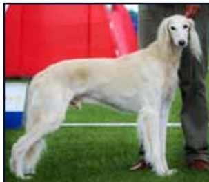
FI CH Kuriirin Amurath 11,5 år

FI CH Amurath Arabanda FI CH, PMV-97 Arabella FI CH Armani