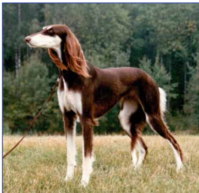
Ch El Hamrah Fainah