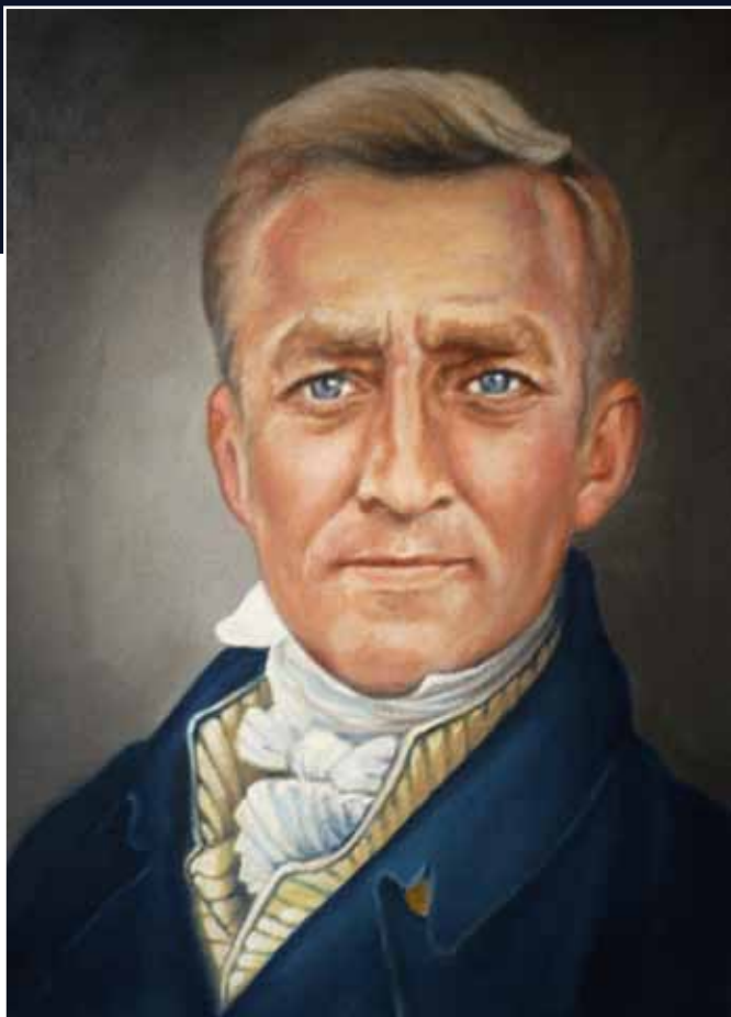
Självporträtt av Hannu Haapala