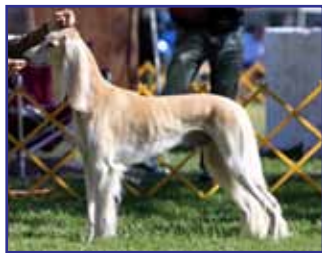
CH Sundara Here Comes The Sun (Blue Nile Vanilla Ice x Sundara's Liberté' De Sundown)