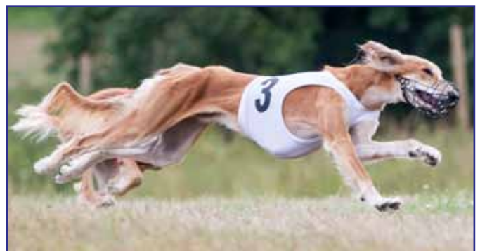
Sharwassim Basim, Basim - fokuserad med stark jaktlust.