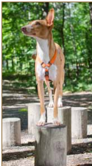
Fram och baktassar på olika objekt.

Tidigare publicerad i Svenska Afghanhundklubbens Årsbok 2014