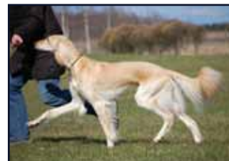
Kuriirin Figaro Foie

Feleste Foie Fidelia Foie Figaro Foie Franceska Foie