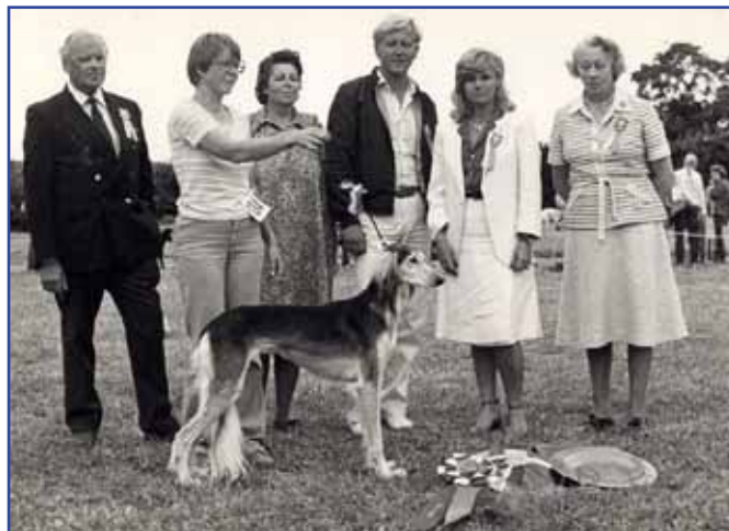
Int Ch V-78,-79 Kirman Elisha BIS Skokloster SvVK 1979 & 1980

År 1979 börjar med Sahrai J-kullen (Sahrai Gibran/El Kelus Farissla), följd av en Sahrai-besläktad kull på tre tikvalpar utan kennelnamn. Kirman har sin J-kull (Kirman Hashmet/Kirman Amritaya). Hanen Jahangir och tiken Javana