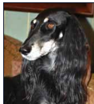
Kuriirin Hoopa Navajo