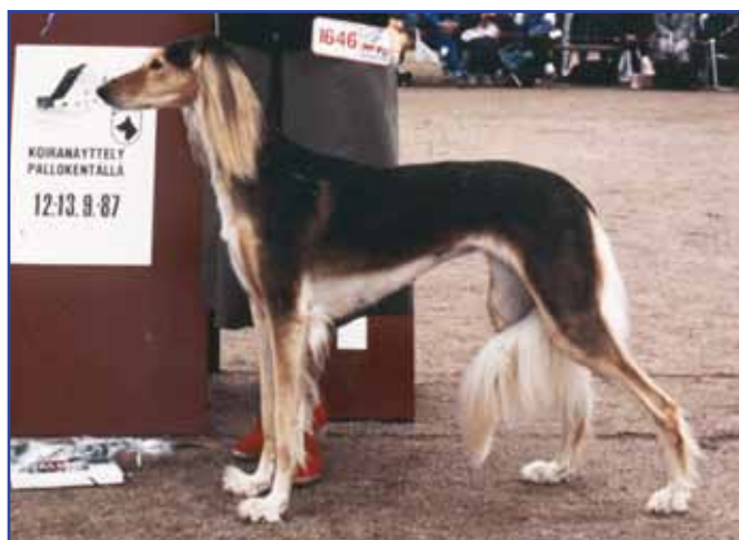
Int Ch V-87 KbhV-89 WW-89 El Hamrah Giah