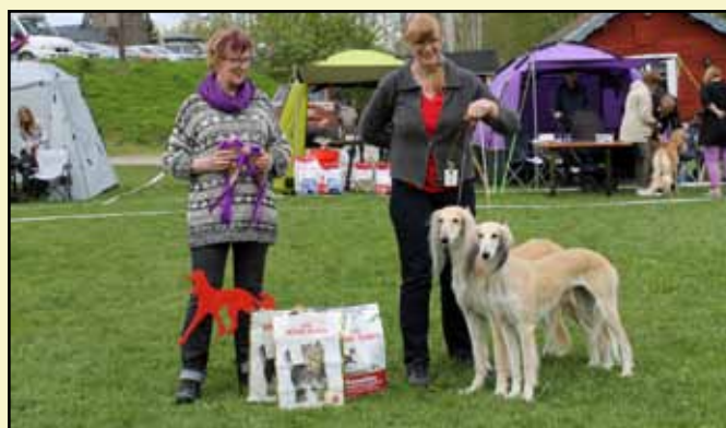
BIS PAR Galerita's Doset Daram & Galerita's Pilosella

Tack än en gång till arrangörerna och alla utställare för en mycket rolig och trevlig lördag. 🐾