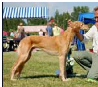
FI CH Kuriirin Empedor May

Emina May FI CH Empedor May Erena May Escador May Evana May