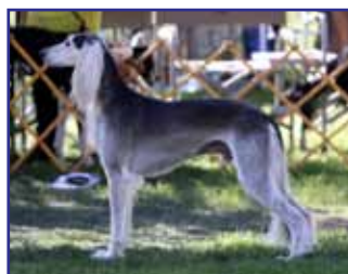
Select Dog: CH Z'Bee The Time of Your Life at Mazada (Z'bee's Prestigious Presto x Z'bee's Strike A Pose)