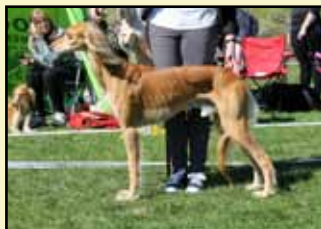
BÄSTA KOMBINERAT Dhawati Uday Karam