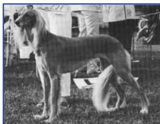
INT NORD CH Sahrai Henna-el Safajah, född 1978 (FI & SE Ch Sahrai Fahim - Sahrai Aisah-Tamasa)