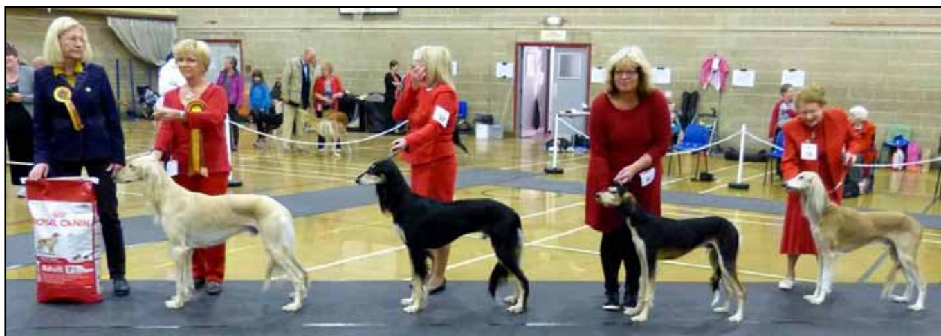
BIR/BIS, bästa hane CH Glenoak Kiyon JW, Reserv bästa hane CH Classicus Cassander, bästa hanvalp Kasaque Shabaz Nefisa & bästa veteranhane Caryna Bacchus at Ilsham.

ningar. De yngre och äldre klasser är indelade efter ålder men flertalet andra klasser baseras på tidigare erövrade placeringar och meriter. Dock finns det ingen championklass och även färdiga champions tävlar om certen, eller CC, Challenge Certificate, som det heter.