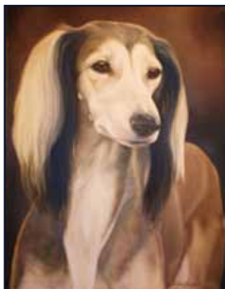
Saluki i olja på canvas