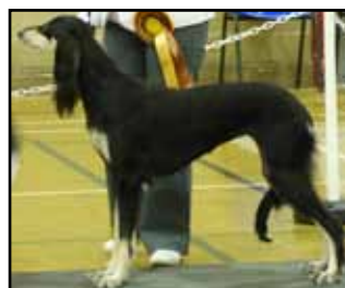
Best Bitch, Challenge CC, Reserve BOB/BIS, BOS CH Caryna Melichia SH.CM