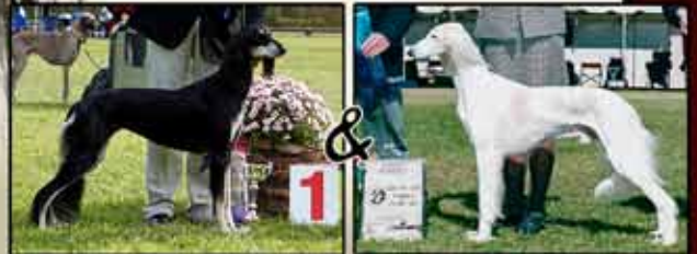
AZIZ HAIFA x BALANA'S RAFI RASIL OF KHAYA