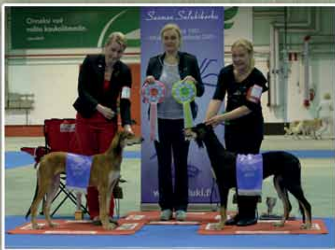
Saluki Show 12.4.2015 BIS El Hamrah Majeeda BOS El Hamrah Marmar

The Ms have taken their first steps in puppy classes: