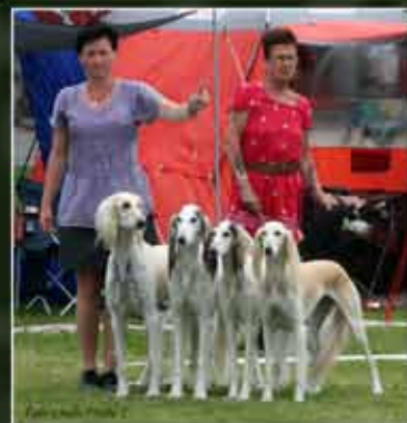
Best in Show at Skokloster Sighthoundclub show

Baqir finished his DE CH title with 2 BOB & Group 3 he also won 3 Cacib. Looking forward to see more of his offspring in the rings in the future.