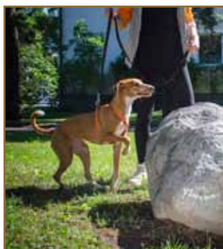
Hunden förbereder sig lugnt och behärskat... Upp på stenen...