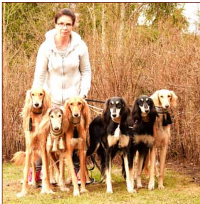
...and with the girls.