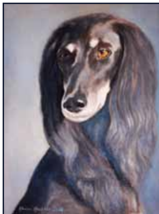
Saluki i olja på canvas